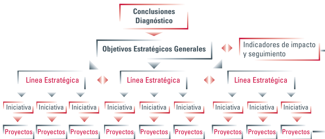
Figura 1: Estructura de contenidos de la Estrategia de la Sociedad de la Información de Castilla y León.

Finalmente, la cuarta y última parte del documento establece el modelo de gestión de la Estrategia, en el cual se definen los órganos y mecanismos de control y seguimiento de la ejecución del mismo.