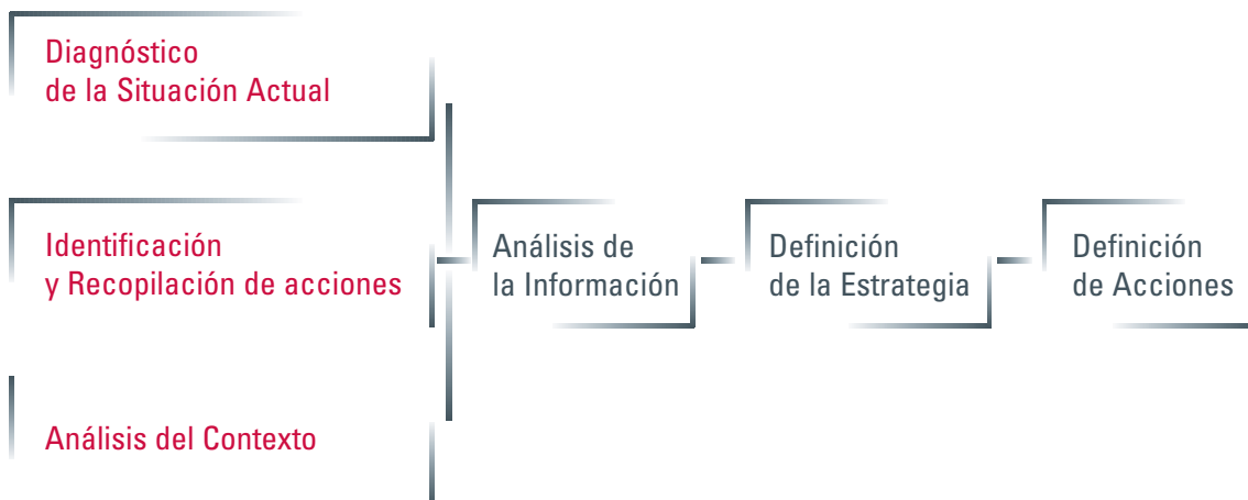
Figura 2: Metodología aplicada para la elaboración de la Estrategia.

Recopilados y analizados estos datos, se abordó la definición de la estrategia general, a partir de la cual se construyó la estructura de acciones a ejecutar, una vez racionalizadas para evitar duplicidades o carencias.